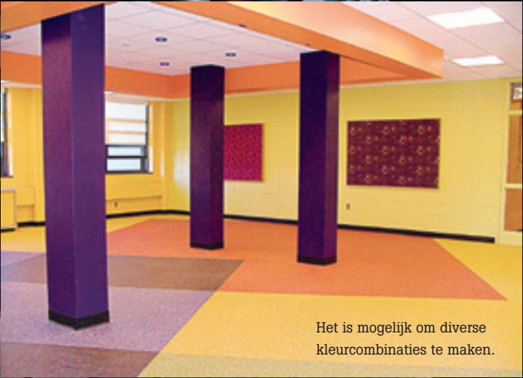
Het is mogelijk om diverse kleurcombinaties te maken.

Het effect van een granieten vloer ontstaat door toevoeging van gekleurd granulaat.