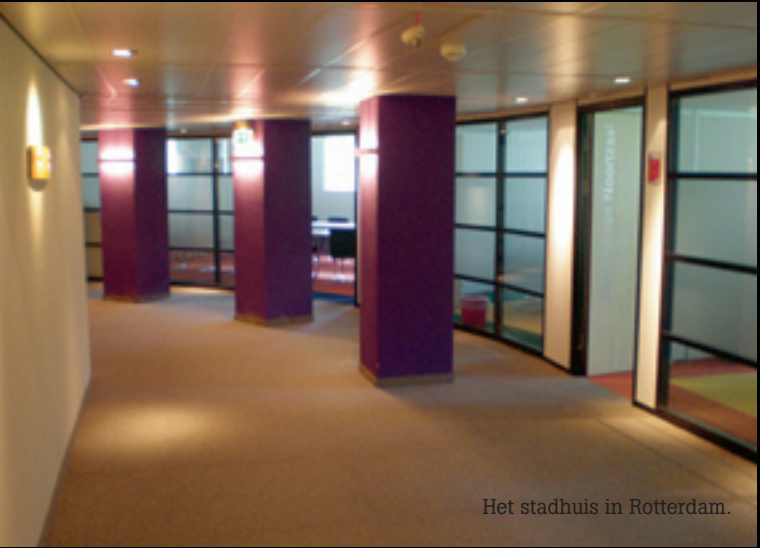
Het stadhuis in Rotterdam.

Autobanden als projectvloer, kan dat? Zeker. Het bedrijf dat daar zijn specialisme van heeft gemaakt, is DW Flooring in het Gelderse Epe. DW Flooring is Europees distributeur van Dinoflex rubberen vloeren. Dinoflex Europe is al ruim 15 jaar actief in Nederland en in Europa. De grondstof voor de vloeren zijn gerecyclede autobanden en dat betekent dat zwart de hoofdkleur is. Middels het toevoegen van 28 kleuren granulaat is het echter mogelijk om de kleuren aan te passen, zodat het effect van een granieten vloer ontstaat.